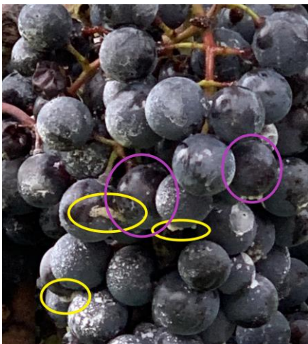
Malbec mit aufgeplatzten Beeren (gelb) und beginnender Essigfäule (violett)

Wie heisst es so schön: Kein Jahr gleicht dem andern. Ein eher feuchter August und September schliesst ein grandioses Rebjahr 2022 ab.