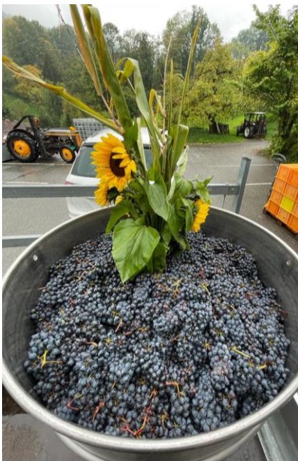
Die letzte Stande wurde hier eingebracht.